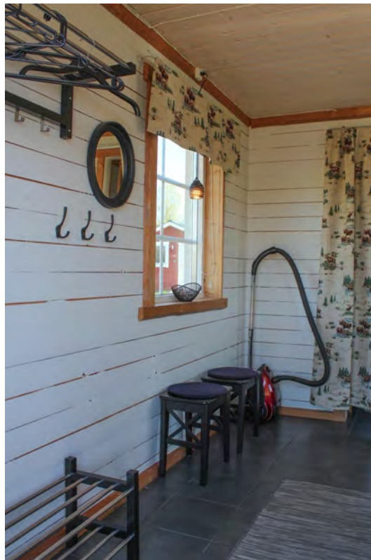
Stuga med kök