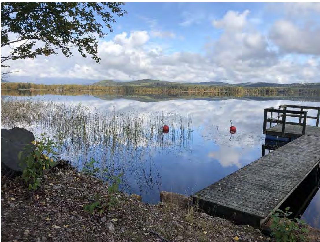
Bryggan vid älven