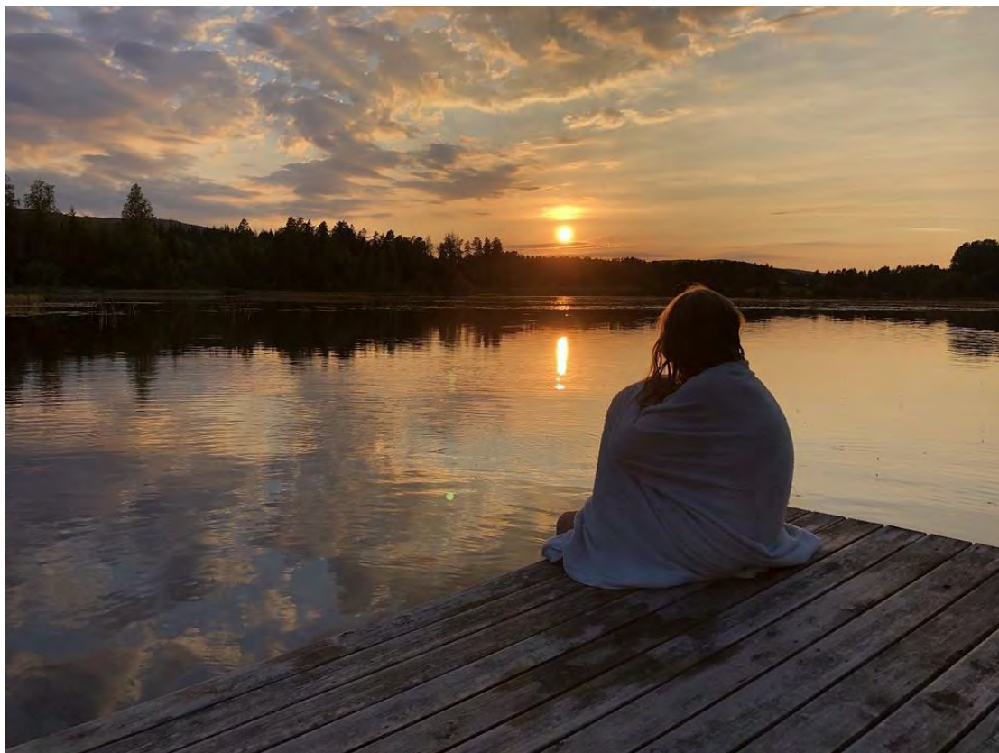
Kan det bli bättre.....