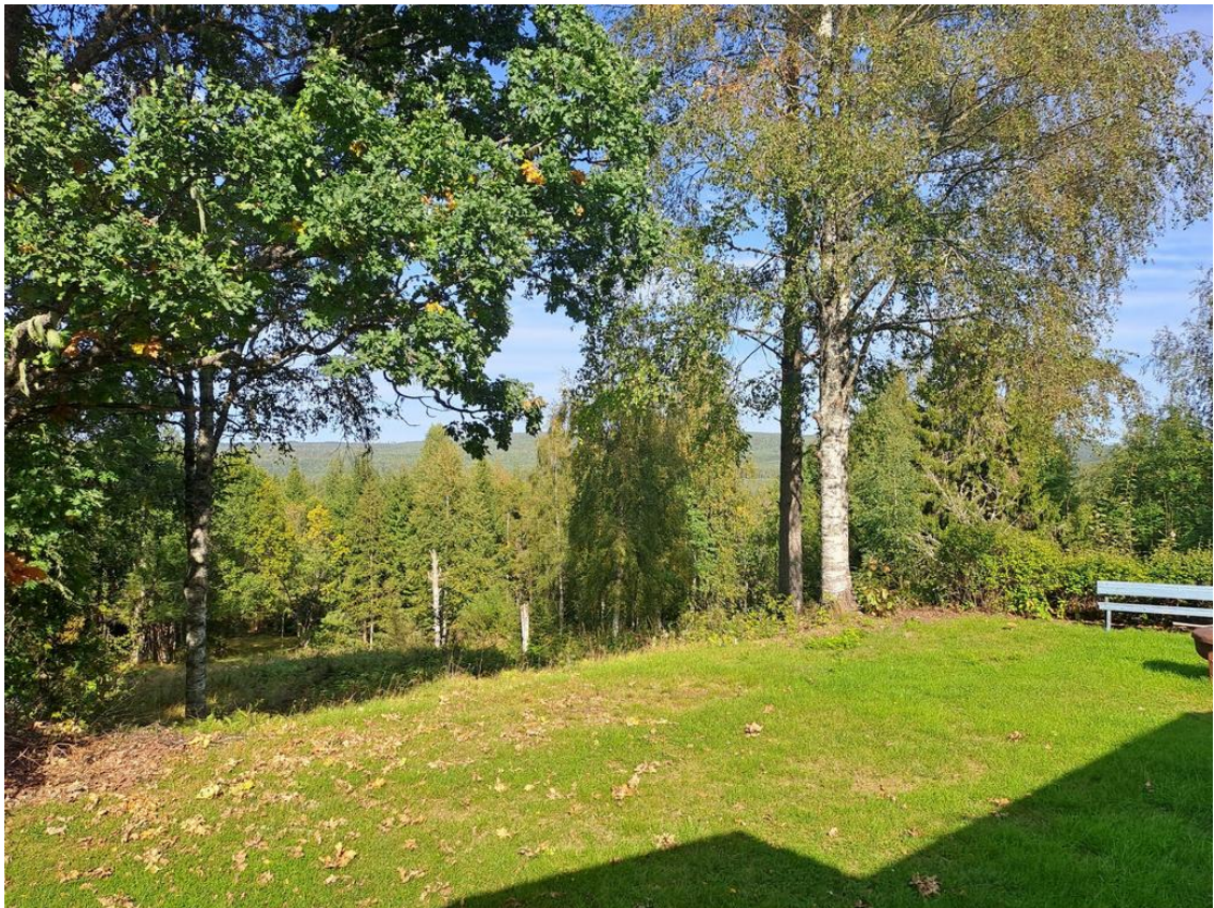
Utsikt från trädgården